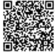
WeChat 微信快速绑定银行卡步骤