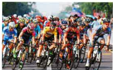
▲ツアー・オブ・ハイナン