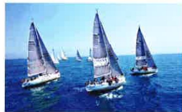
▲海南国際ヨットレース