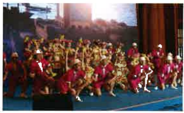
▲海南国際旅遊島歌楽節