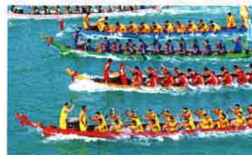
▲万寧中華ドラゴンボートレース