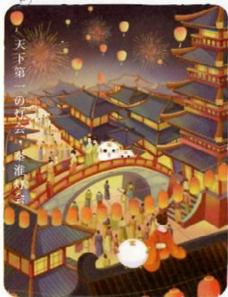
天下第一の灯会・秦淮灯会

朱元璋は南京に世界文化遺産だけでなく、自らが「延長殿」と呼ぶ元宵灯会を創った。毎年の元宵節の祝賀時間を10夜に延長し、これは中国史上最も長い期間の灯祭となった。