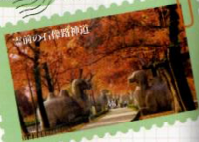
麒麟の石像路神道