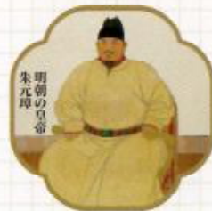
明朝の皇帝 朱元璋