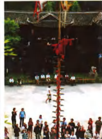
トチャ族の「刀の山に上る」