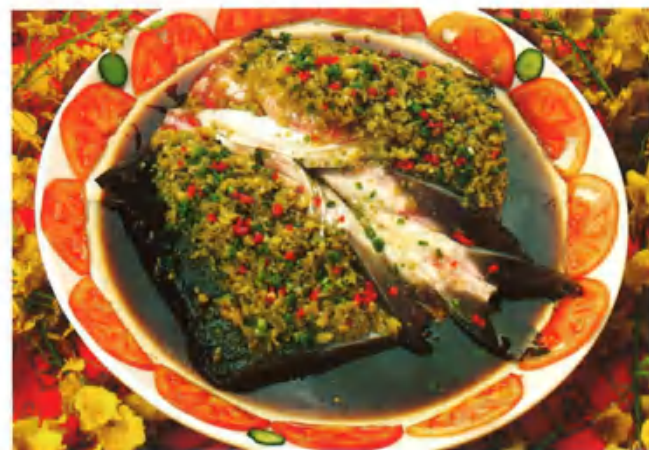
湖南の名菜「泡椒魚頭」

登山ケーブルカー：「天子山」ケーブルカー。上がりは52元/人で、下りは42元/人となっている。「黄獅寨」ケーブルカー。