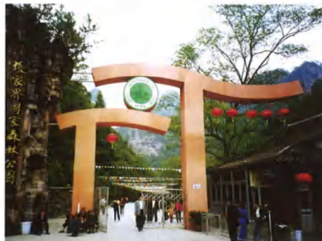
張家界国家森林公園

張家界国家森林公園は、またの名を青岩山と称されており、張家界市北部35kmの場所に所在する中国最初の国家森林公園で、木々の種類が多く、うっそうとした森林を以って有名である。あたりは奇怪な形をした石が転がり、泉や滝も多く、珍しい鳥類や獣が生息している。現在までは黄獅寨、金鞭溪、腰子寨、砂刀溝、琵琶溪、袁家界などの見どころがある。