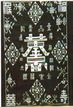
トチャ族の刺繍「黄金万両」