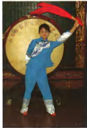
トチャ族の民俗ショウ