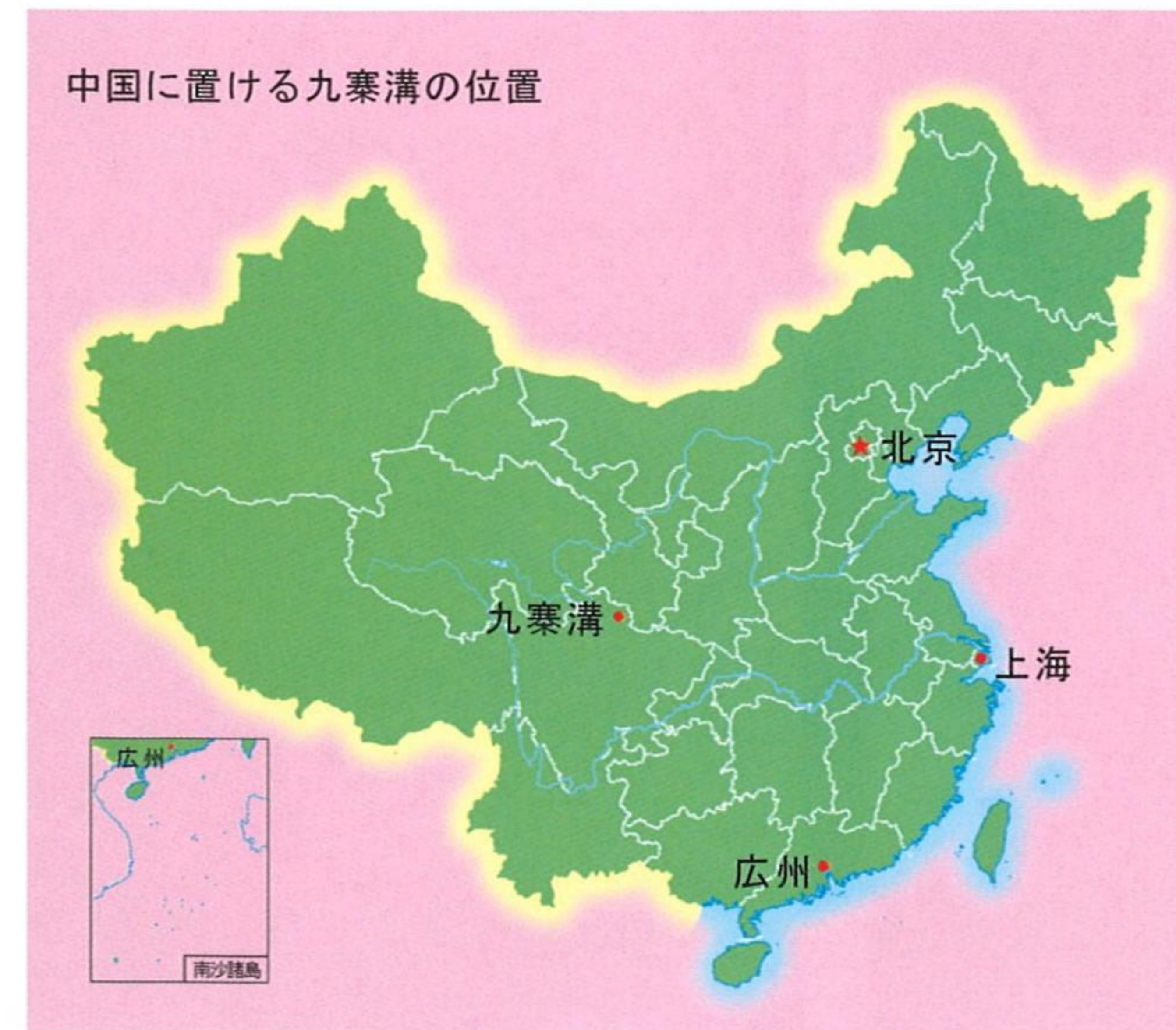
中国に置ける九寨溝の位置

区内交通: 九寨溝観光区内には、便利なエコロジーのバッテリーカーが運行し、指定される停留所で乗り降りできる。乗車券は、入場券と共に買える。乗車料はオンシーズン(5月1日~10月)に90元、オフシーズンに70元、保険料は3元。