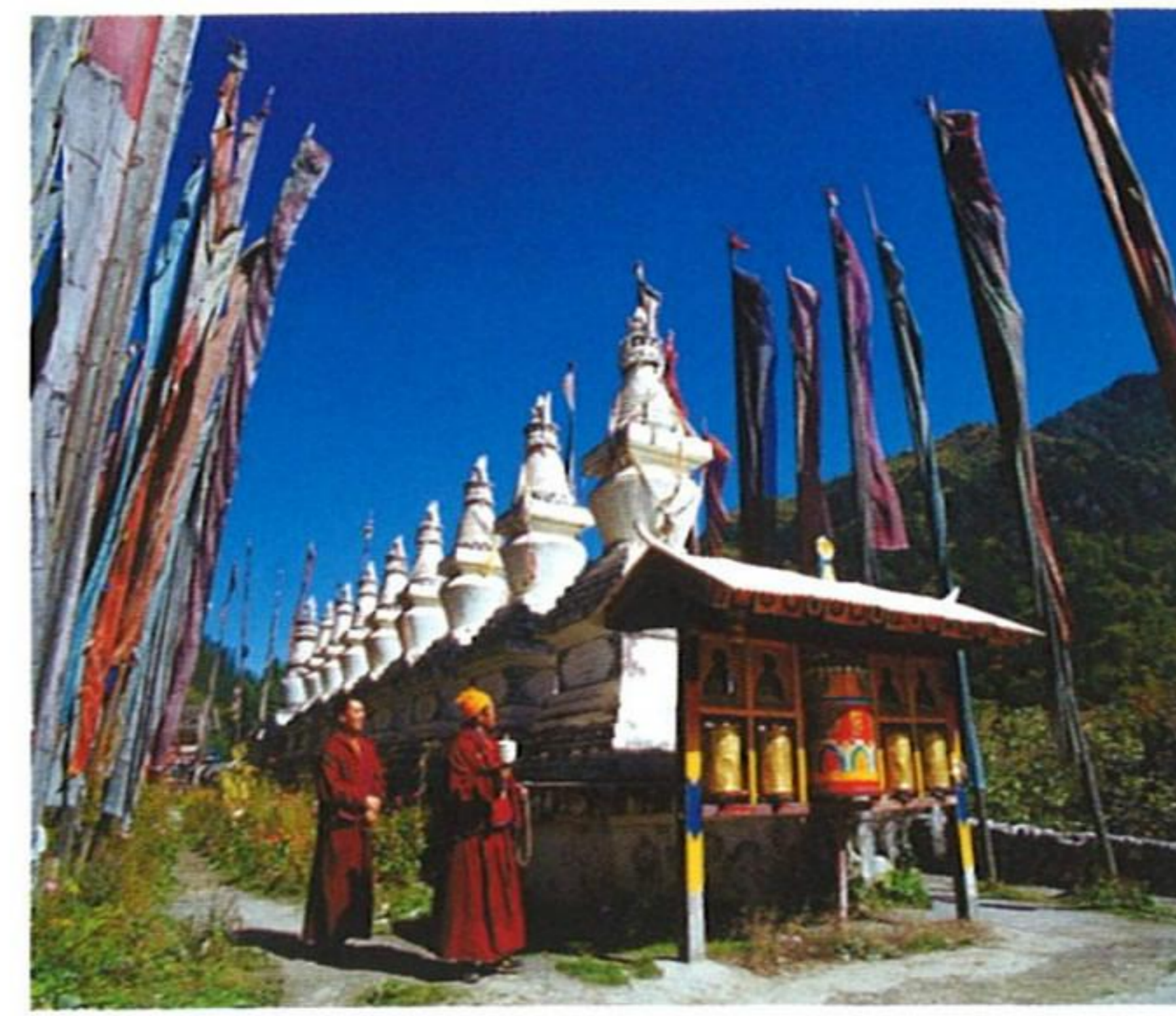
チベット族の祭風景