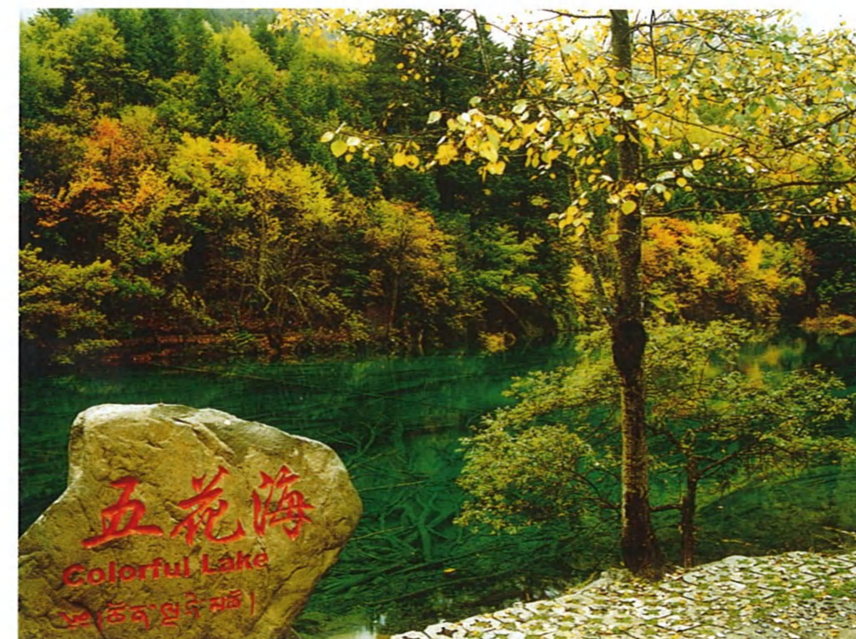
カラフルな五花海