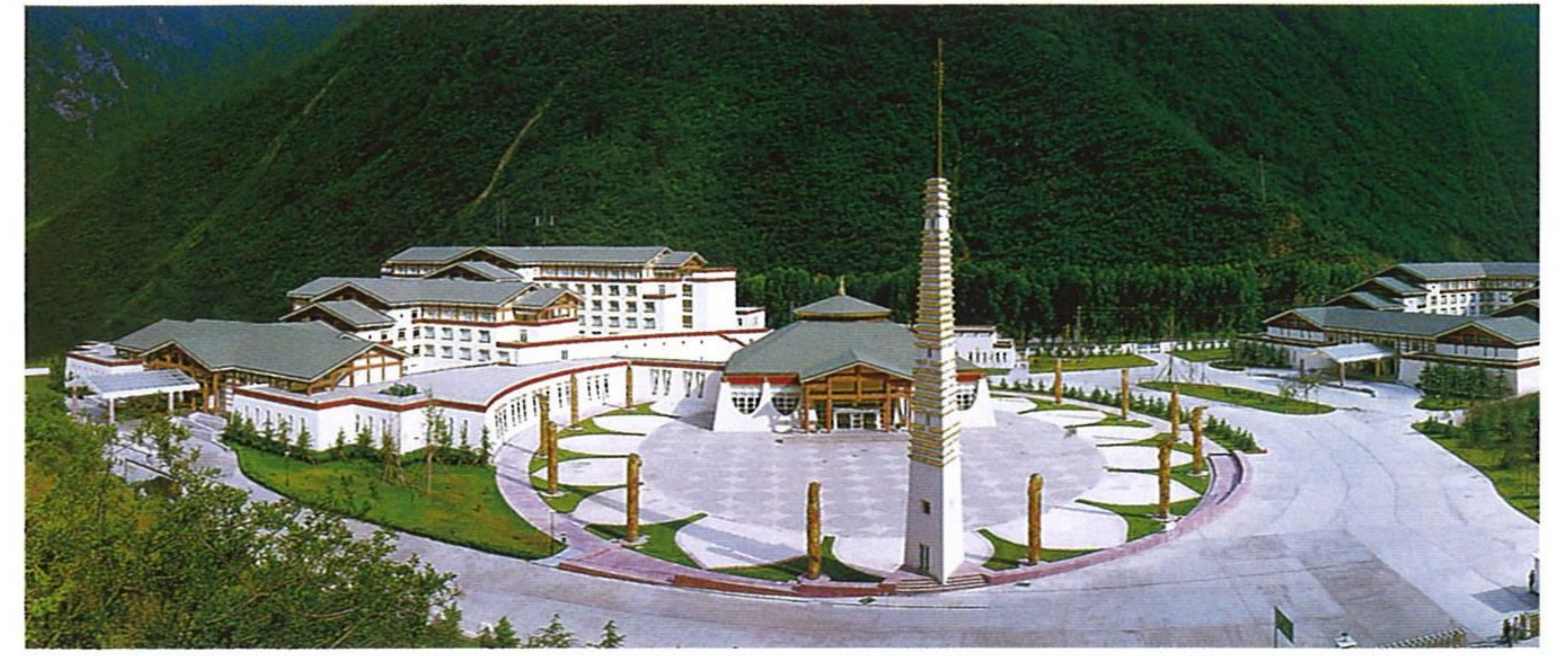
九寨溝国際大酒店