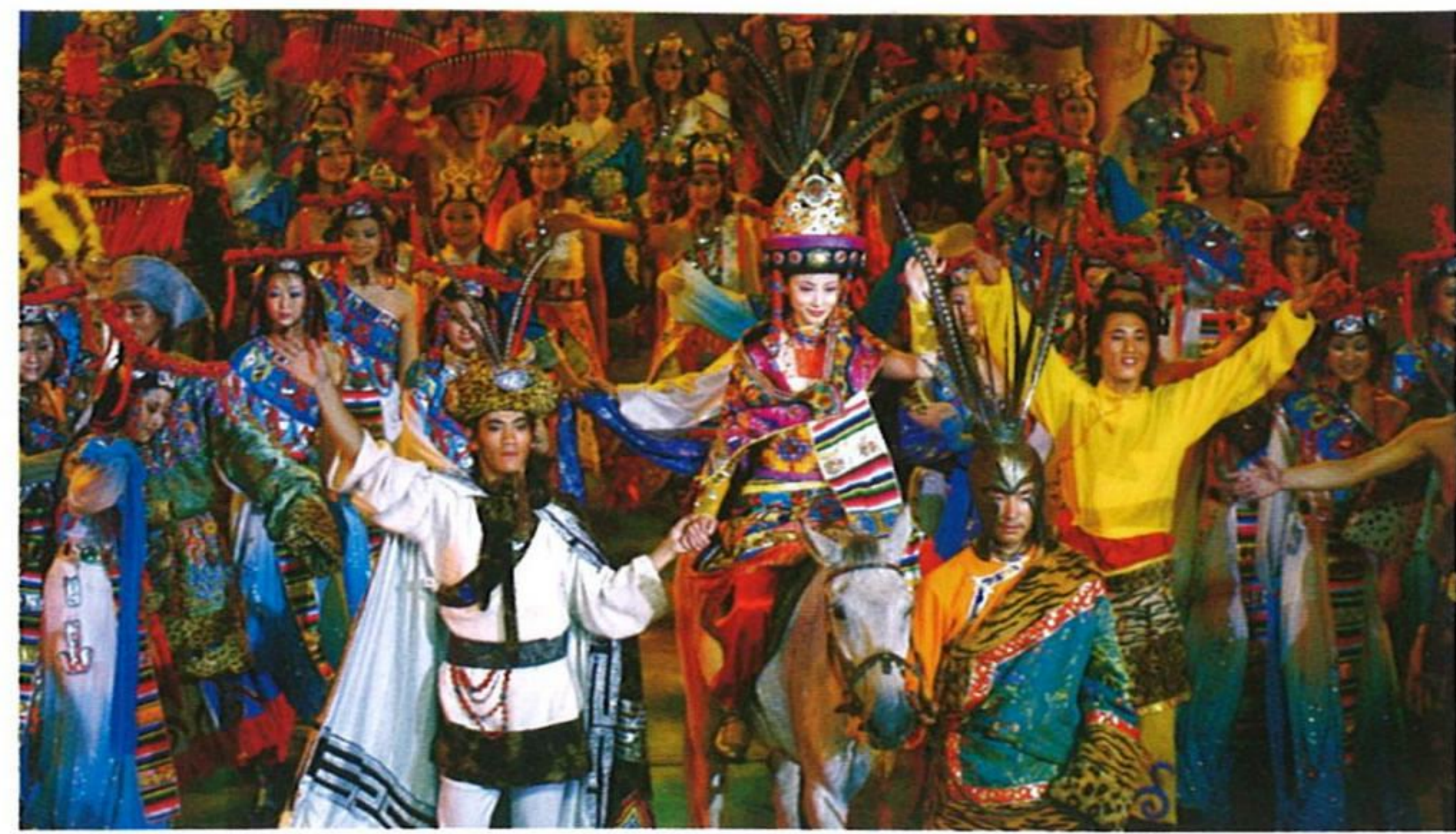
天堂大劇院のチベット族のミュージカル

属は熱帯に、342属は温帯に、16属は汎地中海に分布し、15属は中国特有の植物で、藻類は6門、32科、74属、312種あり、うち中国の関係文献には記されないものが43種(変種を含む)ある。