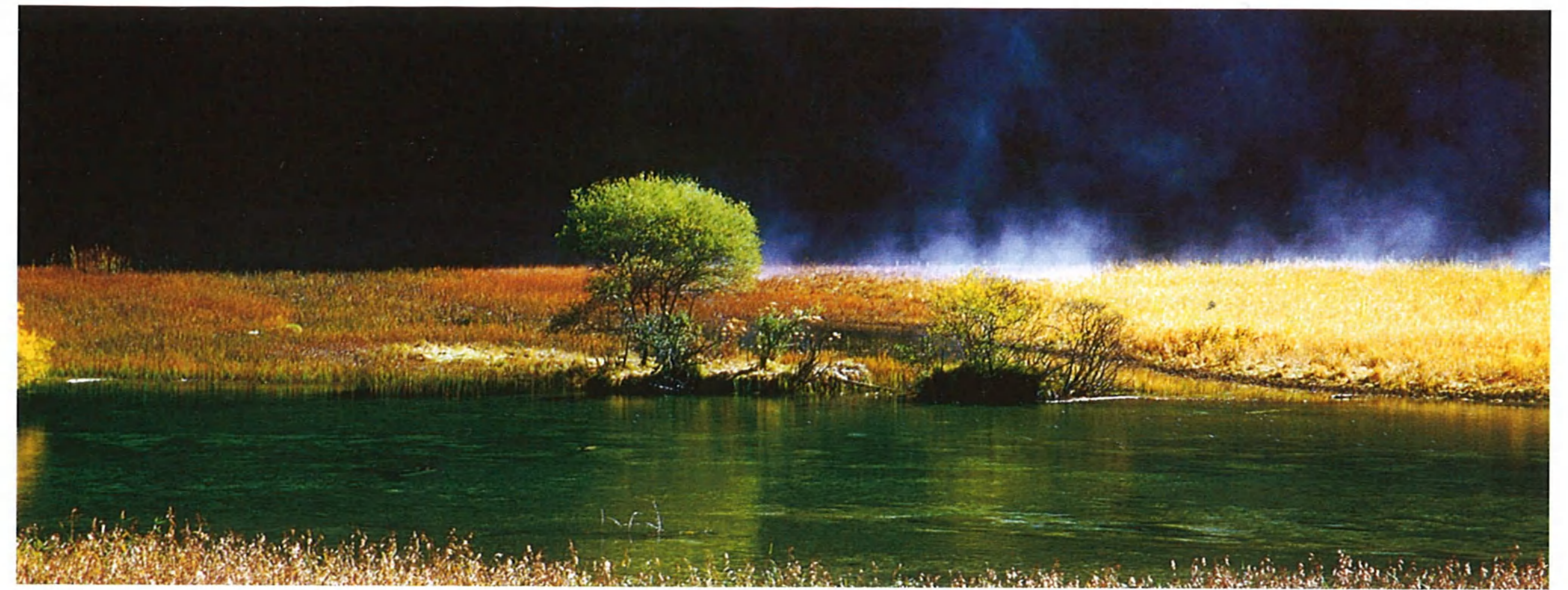
景色雄大な芦葦海

滝。浅黄色のトラパーチンの灘を流れている清い水は、大小様々な「生物的カルスト地形」の灘に、数え切れないほどの水玉をしぶき、陽射に照らされると真珠のようにピカピカと煌く。落差28m、幅310mの珍珠灘瀑布は新月の形を呈している。広々とした滝は真珠灘から勢いよく飛びこみ、環状の水スクリーンを広げている。滝は轟くように響きながら淵に落とし、しぶきを激しく飛ばしている。雄大な氣勢を見せている。