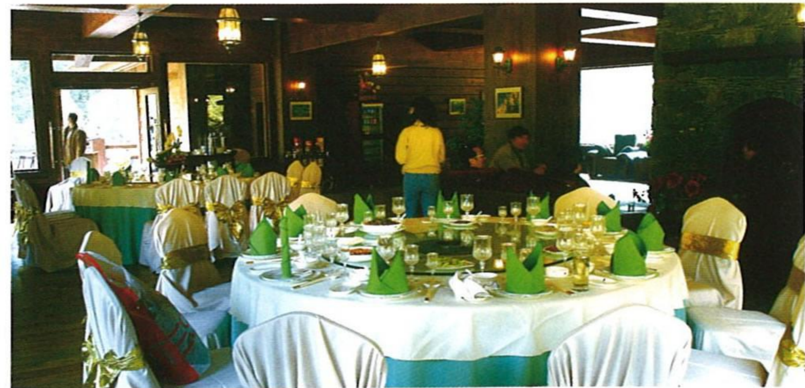
天堂度假中心レストラン

九寨溝の各ホテルは、観光客に正真正銘の四川料理、広東料理、安徽料理、西洋料理、地元のチベット料理を提供している。施設が整備されるレストランは、観光客の憩いの場。あるホテルは、九寨溝観光の特徴に応じて、持ち替えの食品も用意している。観光客は、観光しながら美食を堪能。